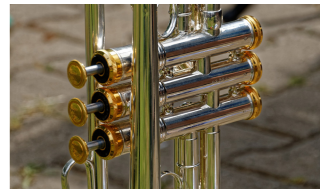
Der Posaunenchor probt jeweils montags und freitags in der Paul-Gerhardt-Kirche.

Bitte beachten: Die Auflistung der Gruppen entspricht dem Stand 1.11.2021. Änderungen sind möglich. Für alle Veranstaltungen gilt die „3G-Regel“. Teilnahme nur mit Nachweis.