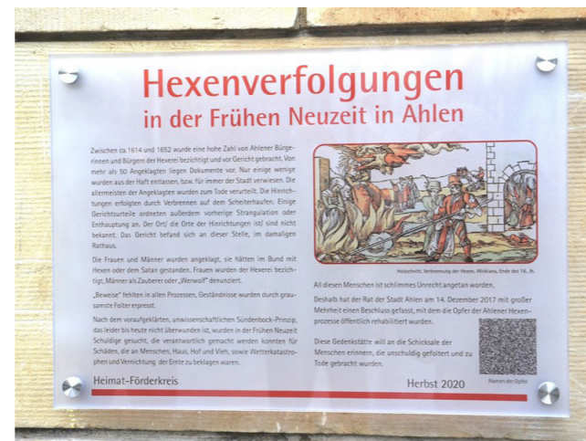
Macht auf die Hexenverfolgung in Ahlen aufmerksam: Die Erinnerungstafel am Alten Rathaus.