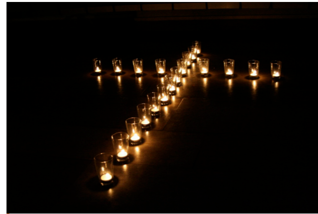
Traditionell werden am Totensonntag an den Gräbern der Verstorbenen Kerzen angezündet.

Den Abschluss bilden dann drei musikalische „Ausklang“-Andachten, jeweils um 18 Uhr in der Pauluskirche, in der Christuskirche und der Paul-Gerhardt-Kirche (alle Termine im Überblick auf der Vorderseite).