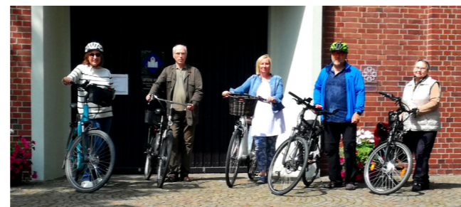
Lädt zur Teilnahme am Stadtradeln ein: Das Umweltteam der Evangelischen Kirchengemeinde Ahlen.

Wer mitmachen will, kann sich im Gemeindebüro (02382-81350) oder bei Pfarrerin Grebe (0176-14211051) anmelden. Dort können dann auch die gefahrenen Fahrrad-Kilometer angegeben und von dort aus zentral dem Team gutgeschrieben werden. Für alle, die das im Internet selbst erledigen können, ist die Registrierung unter www.stadtradeln.de/ahlen (und dort für das Team „Die Kirchenradler“) möglich.