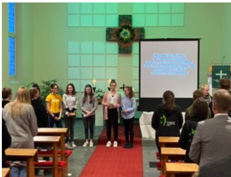
Beschäftigten sich in ihrem Vorstellungsgottesdienst mit Klimaschutz: Die Konfirmandinnen und Konfirmanden der Christuskirche.

„Warum machen wir diese Erde kaputt?“ - diese Frage stellten sich die Konfirmandinnen und Konfirmanden der Christuskirche in einem gemeinsamen Projekt mit der Jugendkirche Hamm. Einen ganzen Samstag lang beschäftigten sie sich mit den Ursachen des Klimawandels, Lösungsansätzen und praktischen Beiträgen. Dazu fertigten sie wiederverwertbare Bienenwachstücher, die künftig Plastik- und Alufolien ersetzen können, oder erprobten das „Upcycling“ von Tetrapacks zu praktischen Täschchen. Abschluss und Höhepunkt bildete der gemeinsam erarbeitete Vorstellungsgottesdienst am Sonntag, bei dem auch die Band der Jugendkirche mitwirkte.